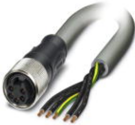
Power cable, 5-pos., gray PVC, 2.5 mm 2 , free cable end to straight 7/8" 16UNF socket, length: 10.0 m

Please be informed that the data shown in this PDF Document is generated from our Online Catalog. Please find the complete data in the user's documentation. Our General Terms of Use for Downloads are valid ( http://download.phoenixcontact.com )