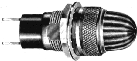
377-0410-1191-203 Stovepipe lens