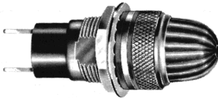
377-0410-1191-203 Stovepipe lens