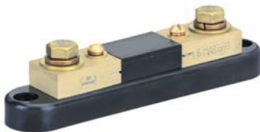
50mV Shunts Portable 150 amp Catalog No. 06714

Leads for these shunts are 5 feet long and are rated at 0.065 ohms resistance. Shunts with a 100 amp rating and below can be certified to NIST standards.