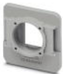
RJ45 panel mounting frame, IP67, for modular socket inserts (Keystone), for round panel cutout, with grommet, with thread and union nut, color: gray

Panel mounting frames - VS-08-A-RJ45/MOD-1-R-IP67 - 1689844