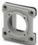
RJ45 panel mounting frame, IP67, for modular socket inserts (Keystone), for square panel cutout, with grommet, without mounting screws, color: gray

Panel mounting frames - VS-08-A-RJ45/MOD-1-IP67 - 1689080