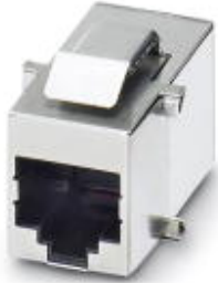
RJ45 socket insert, modular (Keystone), CAT3, 8-pos., shielded, socket on socket

Please be informed that the data shown in this PDF Document is generated from our Online Catalog. Please find the complete data in the user's documentation. Our General Terms of Use for Downloads are valid ( http://download.phoenixcontact.com )