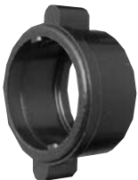
Winged Coupling Ring W/4482