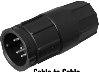
Cable to Cable 5X8X-XXG-XXX Matching Mates: • Cable Pin 3X8X-XPB-XXX • Cable Socket 3X8X-XSG-XXX