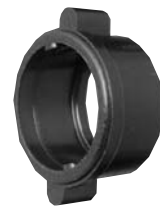
Winged Coupling Ring W/4482