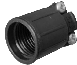
Mechanical Back Shell (Style #5)