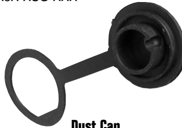
Dust Cap 4295