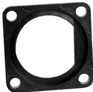
Square Flange Adapter 4296