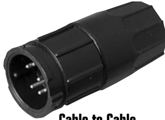
Cable to Cable 5X8X-XXG-XXX Matching Mates: • Cable Pin 3X8X-XPB-XXX • Cable Socket 3X8X-XSG-XXX