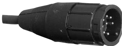
Cable to Cable