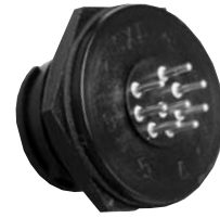
P/C Tail Panel Mount 4XXX-XXG-XXX Matching Mates: • Cable Pin 3X8X-XPB-XXX • Cable Socket 3X8X-XSB-XXX