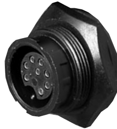
Panel Mount 4X8X-XXG-XXX Matching Mates: • Cable Pin 3X8X-XPB-XXX • Cable Socket 3X8X-XSB-XXX