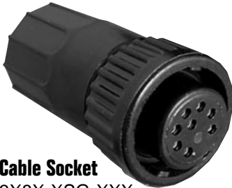
Cable Socket 3X8X-XSB-XXX Matching Mates: • Cable-Cable 5X8X-XPB-XXX • Panel 4XXX-XPB-XXX