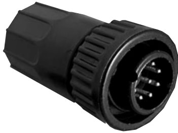
Cable Pin 3X8X-XPB-XXX Matching Mates: • Cable-Cable 5X8X-XSB-XXX • Panel 4XXX-XSB-XXX