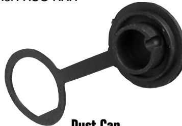
Dust Cap 4295