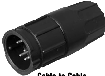
Cable to Cable 5X8X-XXG-XXX Matching Mates: • Cable Pin 3X8X-XPB-XXX • Cable Socket 3X8X-XSB-XXX