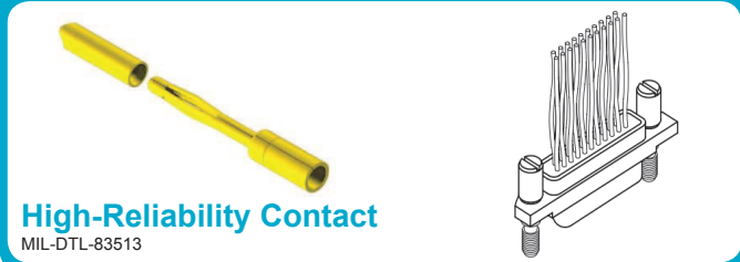
High-Reliability Contact MIL-DTL-83513