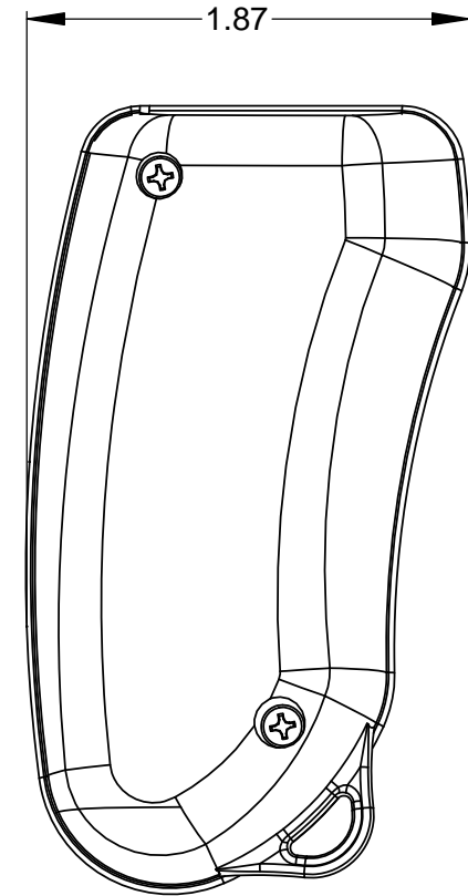
TOP VIEW SHOWING CIRCUIT BOARD DIMENSIONS