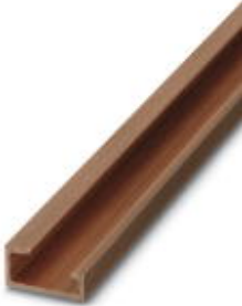
G-profile DIN rail, deep-drawn, material: Copper, unperforated, height 15 mm, width 32 mm, length 2 m

Please be informed that the data shown in this PDF Document is generated from our Online Catalog. Please find the complete data in the user's documentation. Our General Terms of Use for Downloads are valid ( http://download.phoenixcontact.com )