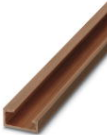
G-profile DIN rail, deep-drawn, material: Copper, unperforated, height 15 mm, width 32 mm, length 2 m

Please be informed that the data shown in this PDF Document is generated from our Online Catalog. Please find the complete data in the user's documentation. Our General Terms of Use for Downloads are valid ( http://download.phoenixcontact.com )