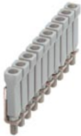
Jumper, Number of positions: 10, Color: gray

Please be informed that the data shown in this PDF Document is generated from our Online Catalog. Please find the complete data in the user's documentation. Our General Terms of Use for Downloads are valid ( http://download.phoenixcontact.com )