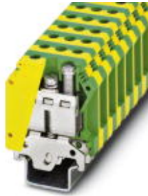
Ground modular terminal block, Connection method: Screw connection, Load current : 150 A, Cross section: 0.75 mm 2 - 50 mm 2 , AWG 18 - 2, Width: 15.2 mm, Color: green-yellow

Please be informed that the data shown in this PDF Document is generated from our Online Catalog. Please find the complete data in the user's documentation. Our General Terms of Use for Downloads are valid ( http://download.phoenixcontact.com )