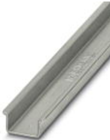
DIN rail, material: Steel, unperforated, height 15 mm, width 35 mm, length: 2 m

Please be informed that the data shown in this PDF Document is generated from our Online Catalog. Please find the complete data in the user's documentation. Our General Terms of Use for Downloads are valid ( http://download.phoenixcontact.com )