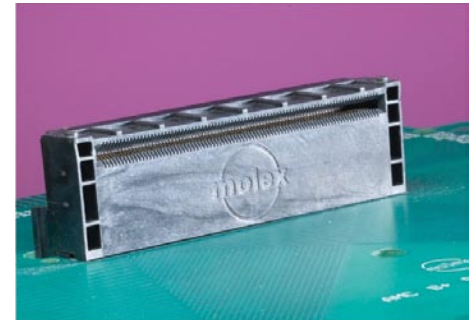
Series 75800 Standard AMC.0 B+ Connector

AMC.0 B+ connectors from Molex support the next generation of mezzanine card standards and 12.5 Gbps speeds