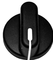
5940E, 5920E, 5930E