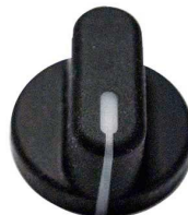
5941E, 5921E, 5931E