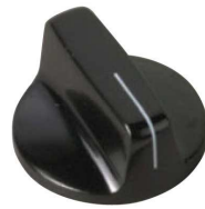
5500E, 5520E, 5521E