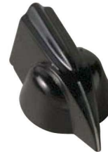
5600E, 5601E, 5602E