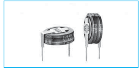
Marking color : White print on an indigo sleeve