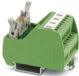
VARIOFACE Professional (VIP) module for Siemens ET200 ISP controllers

Please be informed that the data shown in this PDF Document is generated from our Online Catalog. Please find the complete data in the user's documentation. Our General Terms of Use for Downloads are valid ( http://phoenixcontact.com/download )