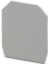
End cover, Length: 52 mm, Width: 2 mm, Color: gray

Please be informed that the data shown in this PDF Document is generated from our Online Catalog. Please find the complete data in the user's documentation. Our General Terms of Use for Downloads are valid ( http://download.phoenixcontact.com )