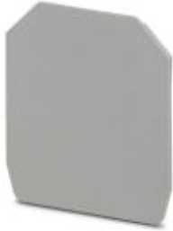
End cover, Length: 52 mm, Width: 2 mm, Color: gray

Please be informed that the data shown in this PDF Document is generated from our Online Catalog. Please find the complete data in the user's documentation. Our General Terms of Use for Downloads are valid ( http://download.phoenixcontact.com )