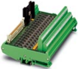
Module with 32 proximity switches (Namur) for input cards of the Delta V control system)

Please be informed that the data shown in this PDF Document is generated from our Online Catalog. Please find the complete data in the user's documentation. Our General Terms of Use for Downloads are valid ( http://phoenixcontact.com/download )