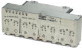
The illustration shows version IBS RL 24 DO 16/8-R-LK

Digital input device for INTERBUS; fiber optic technology with 2 Mbaud, 16 inputs that can be read (24 V DC), sensor connection via 5-pos. M12 female connectors, rugged metal housing, IP67 protection