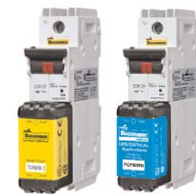
CCP_CF 1-, 2- & 3-Pole switched disconnects Data Sheet 1157