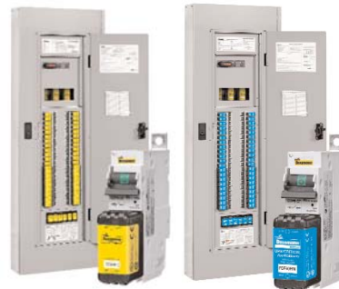
CCPB 1-, 2- & 3-Pole disconnects for the Quik-Spec™ Coordination Panelboard. Data Sheet 1160