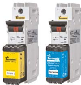
CCP_CF 1-, 2- & 3-Pole switched disconnects Data Sheet 1157