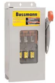
CF_ Quik-Spec™ Safety Switch disconnect (optional window). Data Sheet 1156

The only controlled copy of this Data Sheet is the electronic read-only version located on the Cooper Bussmann Network Drive. All other copies of this document are by definition uncontrolled. This bulletin is intended to clearly present comprehensive product data and provide technical information that will help the end user with design applications. Cooper Bussmann reserves the right, without notice, to change design or construction of any products and to discontinue or limit distribution of any products. Cooper Bussmann also reserves the right to change or update, without notice, any technical information contained in this bulletin. Once a product has been selected, it should be tested by the user in all possible applications.