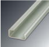
G rail 32 mm (NS 32)

DIN rail - NS 32 AL UNPERF 2000MM - 1201028