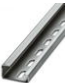
G-profile DIN rail, material: Steel, perforated, height 15 mm, width 32 mm, length 2 m

DIN rail - NS 35/15 CU UNPERF 2000MM - 1201895