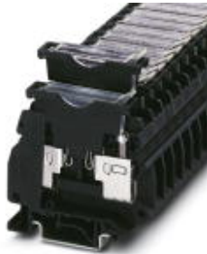
Fuse terminal block, cross section: 0.5 - 16 mm 2 , AWG: 18 - 8, width: 10.2 mm, color: blue

Please be informed that the data shown in this PDF Document is generated from our Online Catalog. Please find the complete data in the user's documentation. Our General Terms of Use for Downloads are valid ( http://download.phoenixcontact.com )