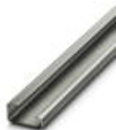
G-profile DIN rail, material: Steel, unperforated, height 15 mm, width 32 mm, length 2 m

DIN rail - NS 32 UNPERF 2000MM - 1201015