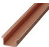
DIN rail, material: Copper, unperforated, 1.5 mm thick, height 15 mm, width 35 mm, length: 2 m

DIN rail - NS 35/15 CU UNPERF 2000MM - 1201895