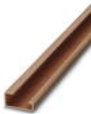
G-profile DIN rail, material: Copper, unperforated, height 15 mm, width 32 mm, length 2 m

DIN rail - NS 32 CU/35QMM UNPERF 2000MM - 1201358