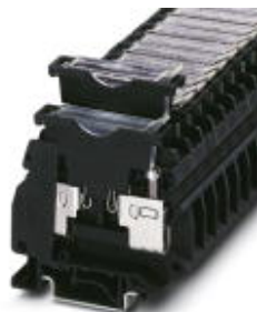
Fuse terminal block, cross section: 0.5 - 16 mm 2 , AWG: 18 - 8, width: 10.2 mm, color: blue

Please be informed that the data shown in this PDF Document is generated from our Online Catalog. Please find the complete data in the user's documentation. Our General Terms of Use for Downloads are valid ( http://download.phoenixcontact.com )