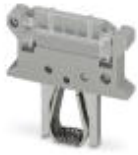
Isolating connector, for using the base fuse terminal block as plug disconnect terminal block