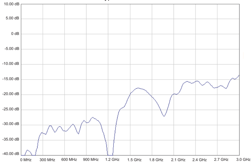
Typical Return Loss