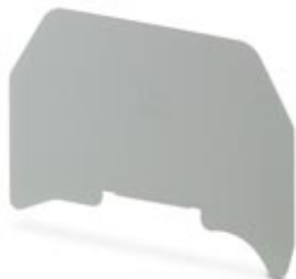
Separating plate, Length: 61 mm, Width: 0.8 mm, Height: 45.5 mm, Color: gray

Please be informed that the data shown in this PDF Document is generated from our Online Catalog. Please find the complete data in the user's documentation. Our General Terms of Use for Downloads are valid ( http://phoenixcontact.com/download )