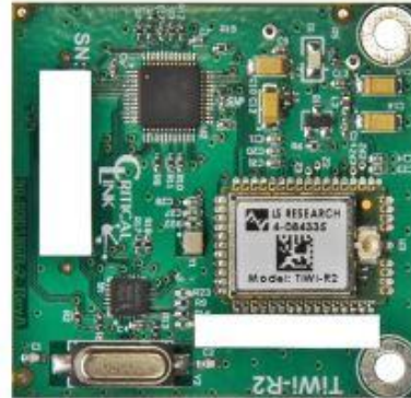
(1.7" x 1.8" – actual size)