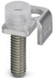
Chain bridge, Number of positions: 1, Color: silver

Please be informed that the data shown in this PDF Document is generated from our Online Catalog. Please find the complete data in the user's documentation. Our General Terms of Use for Downloads are valid ( http://phoenixcontact.com/download )