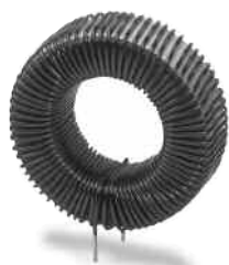
VERTICAL SELF LEADED MOUNT