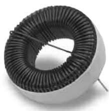
HORIZONTAL SELF LEADED MOUNT