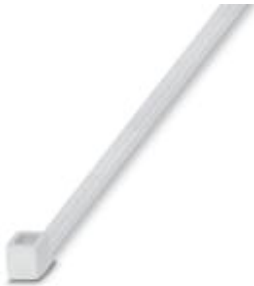
Cable binders for quick and secure bundling, standard version

Please be informed that the data shown in this PDF Document is generated from our Online Catalog. Please find the complete data in the user's documentation. Our General Terms of Use for Downloads are valid ( http://phoenixcontact.com/download )