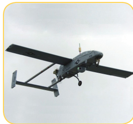
UAV Flight Control

The AHRS440 combines highly reliable MEMS sensors (gyros and accelerometers) with low noise magnetometers to provide accurate attitude and heading in a small and rugged environmentally-sealed enclosure. The AHRS440 provides consistent performance in challenging operating environments and is user-configurable for a wide variety of applications.