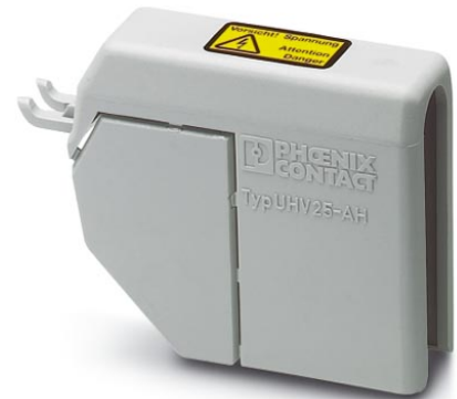
Illustration shows the product version UHV 25-AH

http://eshop.phoenixcontact.de/phoenix/treeViewClick.do?UID=2130473