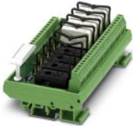
VARIOFACE module, for 8 plug-in miniature relays or miniature optocouplers, with LED, 110 V DC input voltage

Please be informed that the data shown in this PDF Document is generated from our Online Catalog. Please find the complete data in the user's documentation. Our General Terms of Use for Downloads are valid ( http://phoenixcontact.com/download )