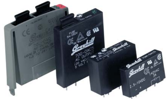
70L-OAC 70G-OAC 70-OAC 70M-OAC