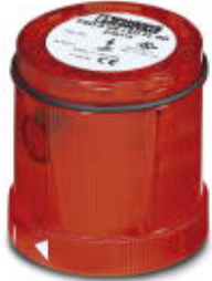
LED flashing beacon element, 24 V DC, double flash, red

Please be informed that the data shown in this PDF Document is generated from our Online Catalog. Please find the complete data in the user's documentation. Our General Terms of Use for Downloads are valid ( http://phoenixcontact.com/download )