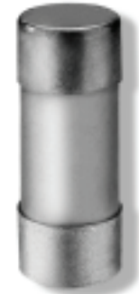
22 x 58

Dimensions to NFC 60200, NFC 63210, NFC 63211 (NFC = French Standard)