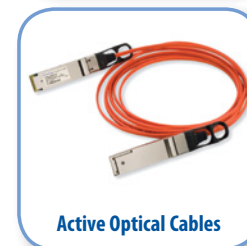
Active Optical Cables