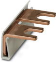
Wiring bridge for modules with connecting pitch 17.5 mm, 1-phase, 2-pos.

Please be informed that the data shown in this PDF Document is generated from our Online Catalog. Please find the complete data in the user's documentation. Our General Terms of Use for Downloads are valid ( http://download.phoenixcontact.com )