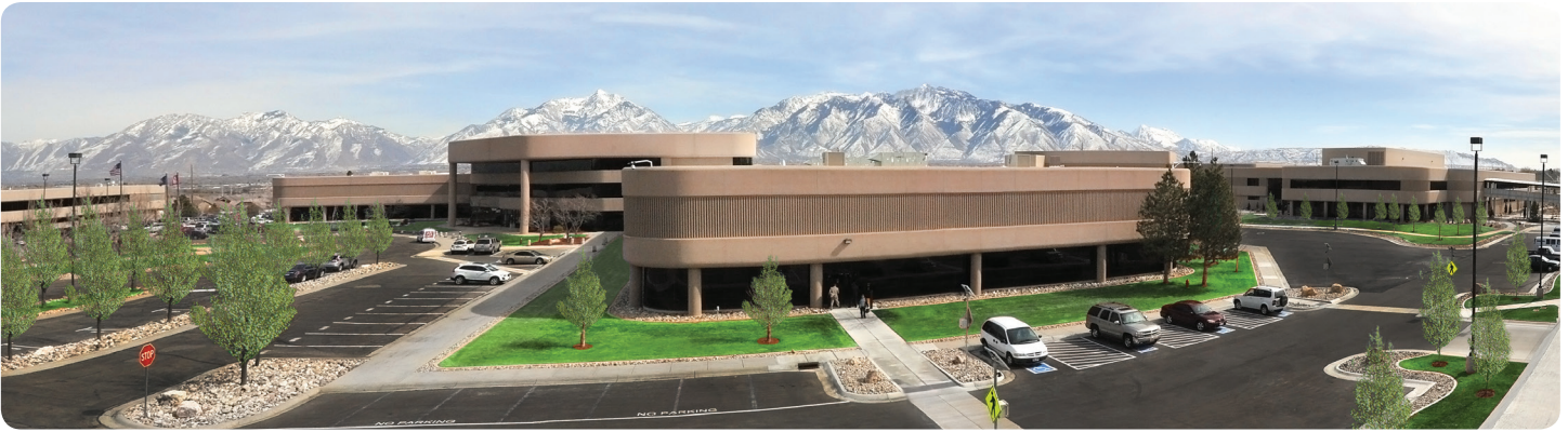
Merit Sensor is based in Salt Lake City, Utah