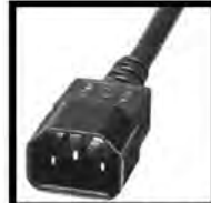
Dual Voltage (IEC320 C14)