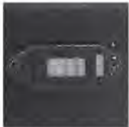
Dual Voltage Selector

ORION FANS fan trays are available in dozens of stock configurations. If you cannot find what you are looking for give us a call. We can design and build your trays from scratch or we can help you come up with solutions for your toughest problems.