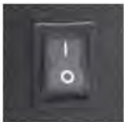
Lighted on/off rocker