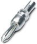
Test plugs, Color: silver