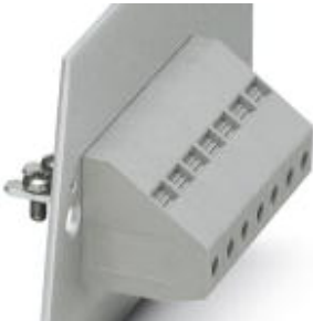
The illustration shows version HDFKV 16-VP in gray

Please be informed that the data shown in this PDF Document is generated from our Online Catalog. Please find the complete data in the user's documentation. Our General Terms of Use for Downloads are valid ( http://download.phoenixcontact.com )