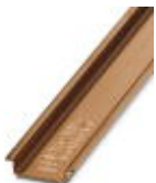
DIN rail, material: Copper, unperforated, height 7.5 mm, width 35 mm, length: 2 m

DIN rail - NS 35/ 7,5 CU UNPERF 2000MM - 0801762