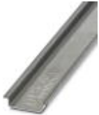
DIN rail, unperforated, Width: 35 mm, Height: 7.5 mm, Length: 2000 mm, Color: silver

DIN rail, unperforated - NS 35/ 7,5 AL UNPERF 2000MM - 0801704