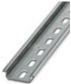
DIN rail, material: Galvanized, perforated, height 7.5 mm, width 35 mm, length: 2 m

DIN rail - NS 35/ 7,5 ZN PERF 2000MM - 1206421