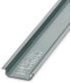
DIN rail 35 mm (NS 35)

DIN rail - NS 35/ 7,5 WH UNPERF 2000MM - 1204122