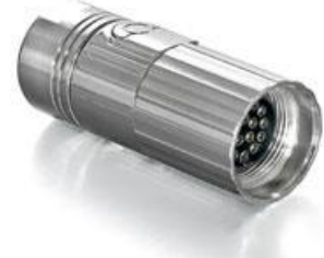
Contact Arrangement mating view

A ST A 876 NN 00 85 200A 000 A S A 876 N 00 85 200A 000