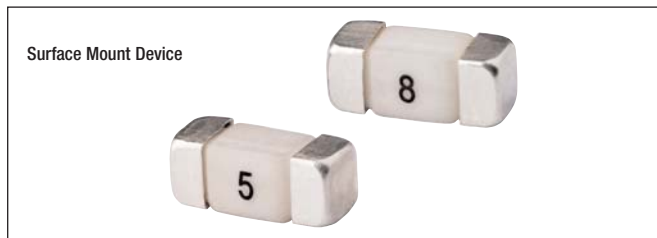
Surface Mount Device