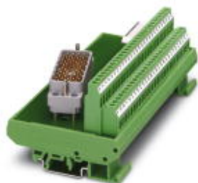
Interface module; connection 1: Screw connection; connection 2: 1x ELCO connector (56-position) (Pin strip, Type 8016, right)

Please be informed that the data shown in this PDF Document is generated from our Online Catalog. Please find the complete data in the user's documentation. Our General Terms of Use for Downloads are valid ( http://phoenixcontact.com/download )