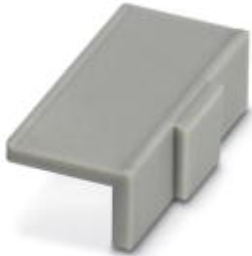
Device marking label, width: 22 mm, area: 22 x 8 mm, e.g. for EML(20x8) R adhesive marking material

Please be informed that the data shown in this PDF Document is generated from our Online Catalog. Please find the complete data in the user's documentation. Our General Terms of Use for Downloads are valid ( http://phoenixcontact.com/download )