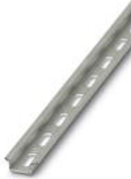
DIN rail, material: Aluminum, perforated, height 5.5 mm, width 15 mm, length: 2 m

Please be informed that the data shown in this PDF Document is generated from our Online Catalog. Please find the complete data in the user's documentation. Our General Terms of Use for Downloads are valid ( http://download.phoenixcontact.com )